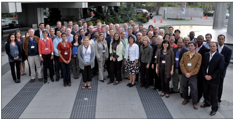
Figura 2. TTT, Santiago Chile TC/Clínica Alemana, Santiago, Octubre de 2009.