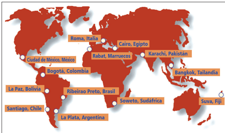
Figura 1. "Training Centers" en el mundo.