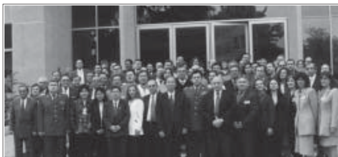
Figura 7. Primer Curso Internacional de Actualizaciones en Gastroenterología. Octubre 2002, Hospital de Carabineros de Chile.