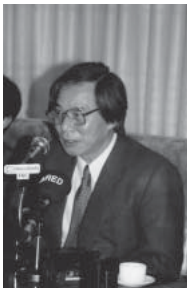
Figura 5a. El Profesor Kyoichi Nakamura dictando una de sus brillantes conferencias en Chile.